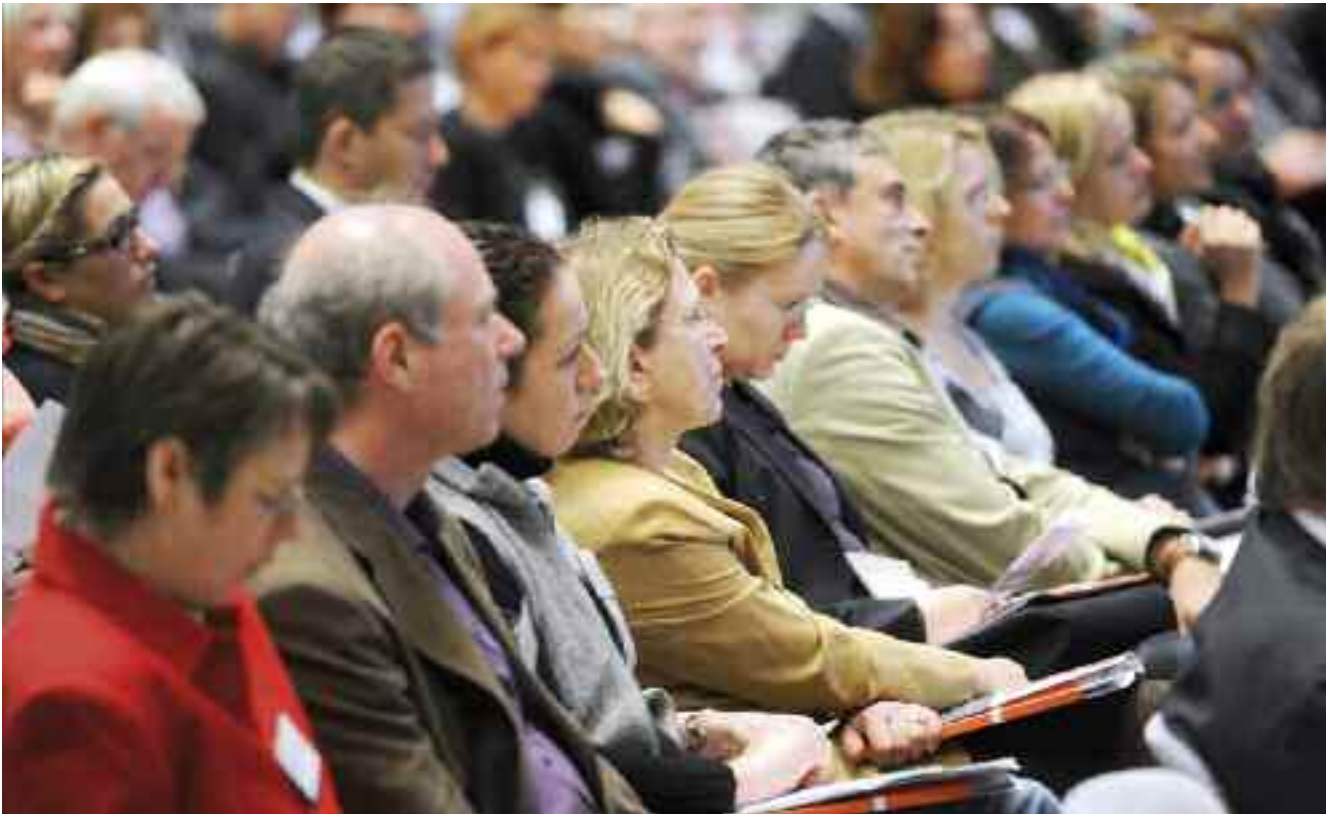
1. und 2. MINT-Lehrerkongress

quetekommission diente und maßgeblich in den Empfehlungen berücksichtigt wurde. Zentrale Anliegen sind der zeitnahe und flächendeckende Ausbau des Englischunterrichts in der Berufsschule, die Empfehlung zum ausbildungsbegleitenden Erwerb der Fachhochschulreife sowie die Idee eines Mehrstufenmodells mit praxisorientierten Berufsvorbereitungsmaßnahmen, Ausbildungsbausteinen und anschlussfähigen zweijährigen Berufsausbildungen.