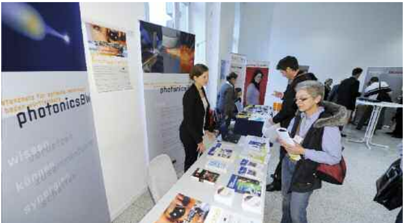
Messeausstellung beim MINT-Lehrerkongress