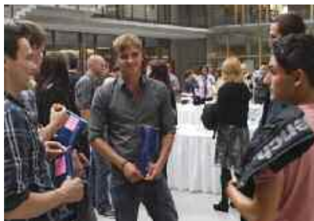
Auszubildende mit dem europass-Mobilität